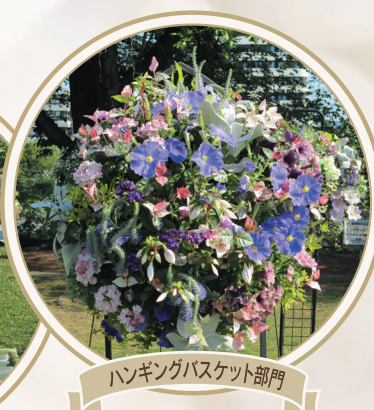
ハンギングバスケット部門